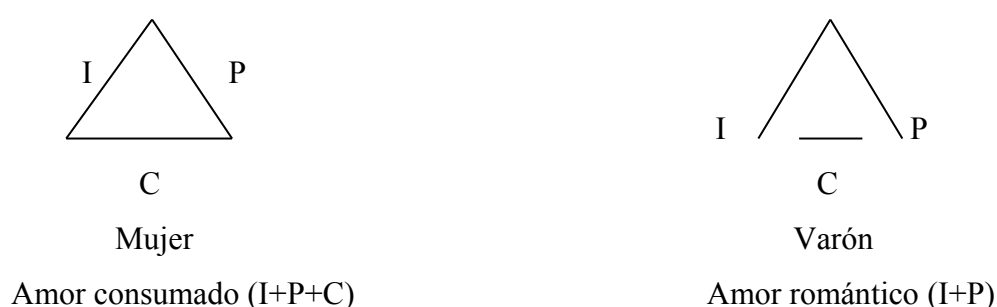
Figura. 1 Triángulos relacionales Amor consumado (I+P+C) vs Amor romántico (I+P)

Por lo tanto en este tipo de relación puede haber un deterioro paulatino, ya que a pesar de haber metas similares, uno de ellos no desea mantener y conservar su amor, a través del compromiso. Pudiendo haber una ruptura, falta de estabilidad, posible disolución y no cumpliendo los ciclos normativos de la pareja.