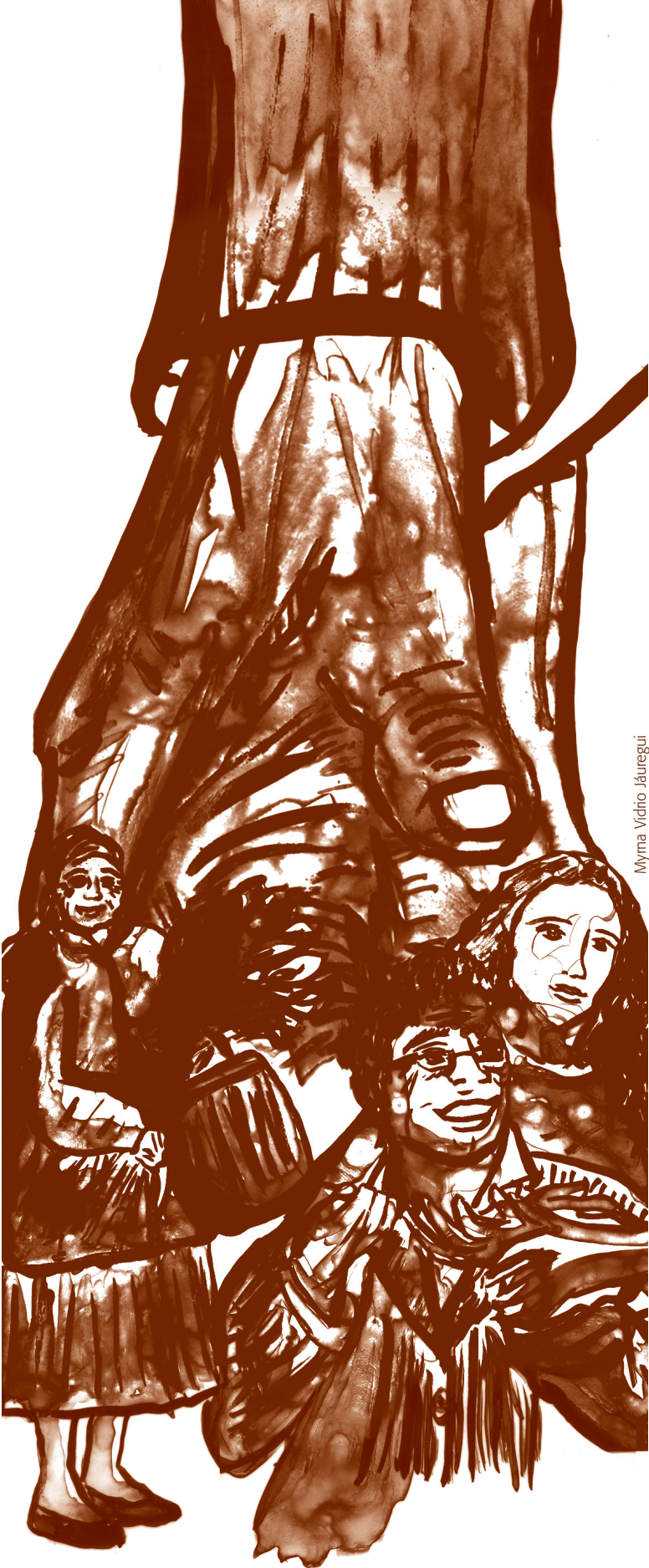
Mýna Víðitíó Járegví