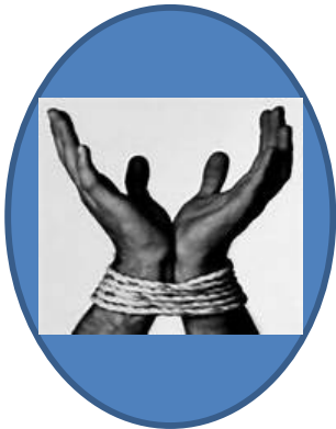
TABLA 1. IMPACTO DEL DELITO Orden de impacto Delito