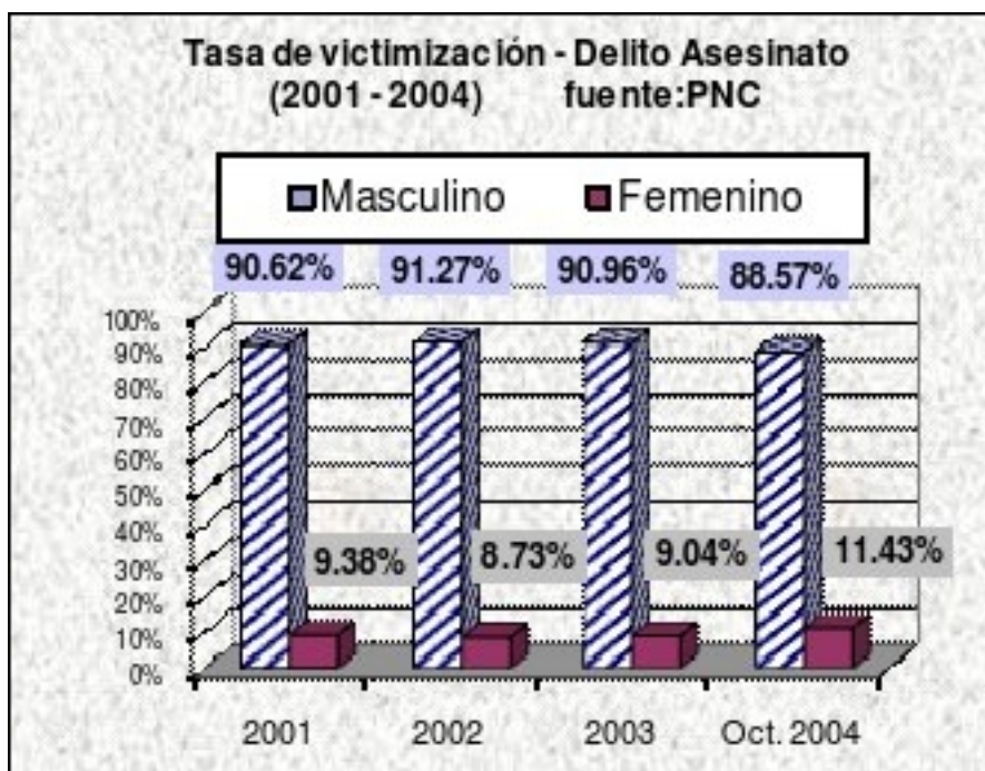
Gráfica 2 86

Durante el año 2003 un equipo de investigación de la oficina del Procurador de los Derechos Humanos (PDH) hizo un estudio de 145 casos de muertes violentas de mujeres y entre las características relevantes se destacaron menores de edad con tiros de gracia, maquiladoras asesinadas mientras esperaban el bus y asesinatos en los que se utilizaron granadas. Un gran número de cadáveres de mujeres muertas violentamente presentó tortura y violación. 87