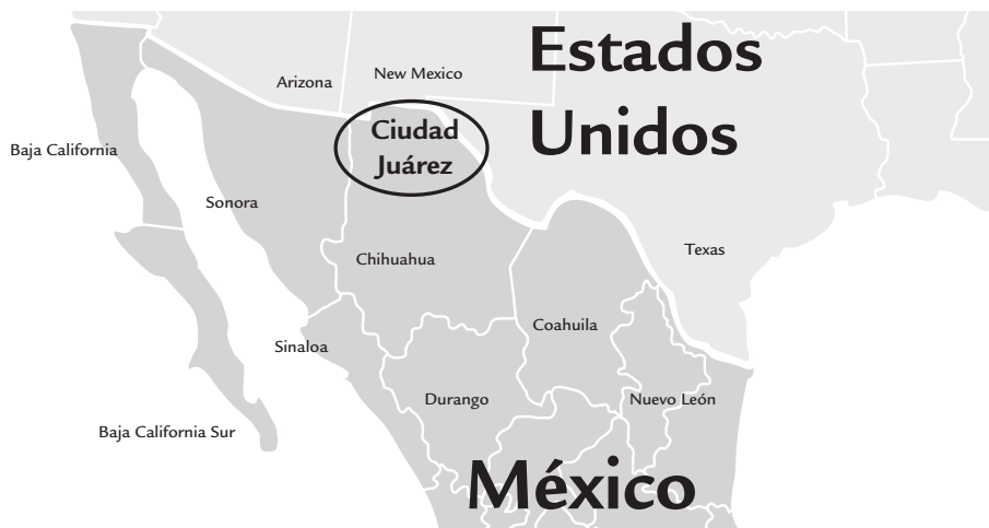
Mapa 1 Ciudad Juárez en la frontera México-Estados Unidos