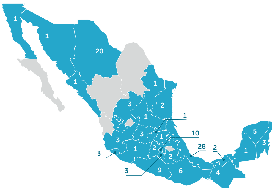
Tabla 9. Distribución de homicidios LGBT+ por entidades de la república mexicana (2019)

Distribuidos por entidades del país, Veracruz encabeza la lista con al menos 28 víctimas, seguido de Chihuahua con 20, la Ciudad de México con 10, y Guerrero con 9 (Véase Tabla 9). Esas cuatro entidades concentran más del 50% del total de los asesinatos de personas LGBT perpetrados a nivel nacional en el año 2019.